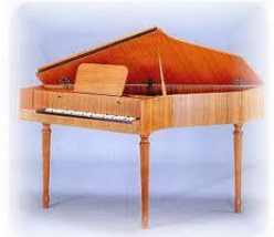
スピネットは、チェンバロの仲間の鍵盤楽器です。